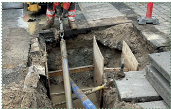
Tilsyn, underboring af vandleddning.

Projektet blev etapeopdelt i to områder; arbejdet med områdets særligt vanskelige trafikale forhold, samt dialog og kontakt med borgerne.